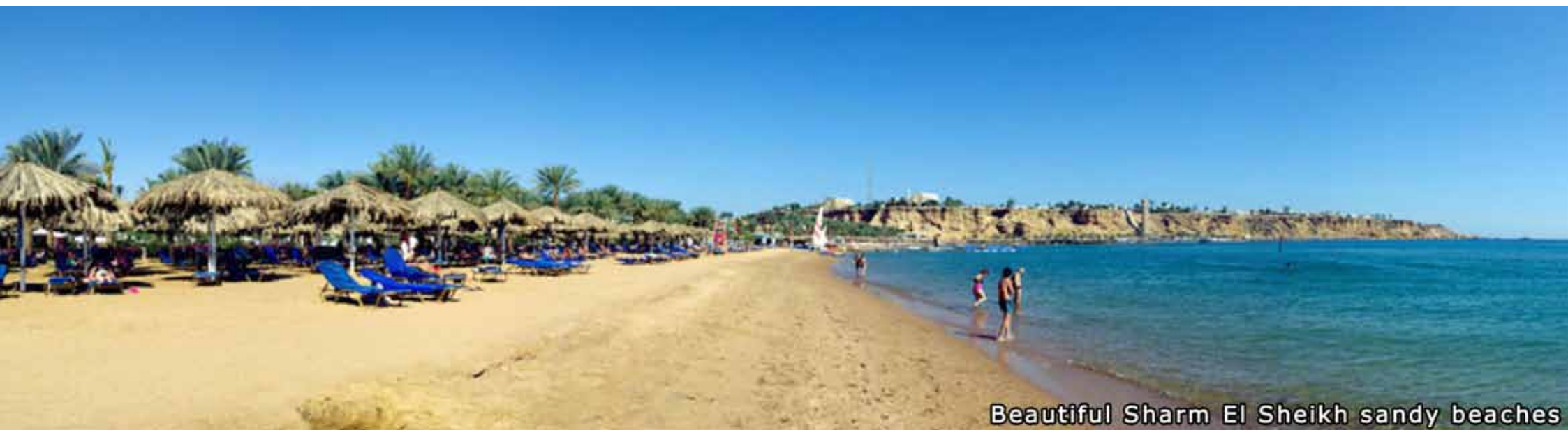
Beautiful Sharm El Sheikh sandy beaches