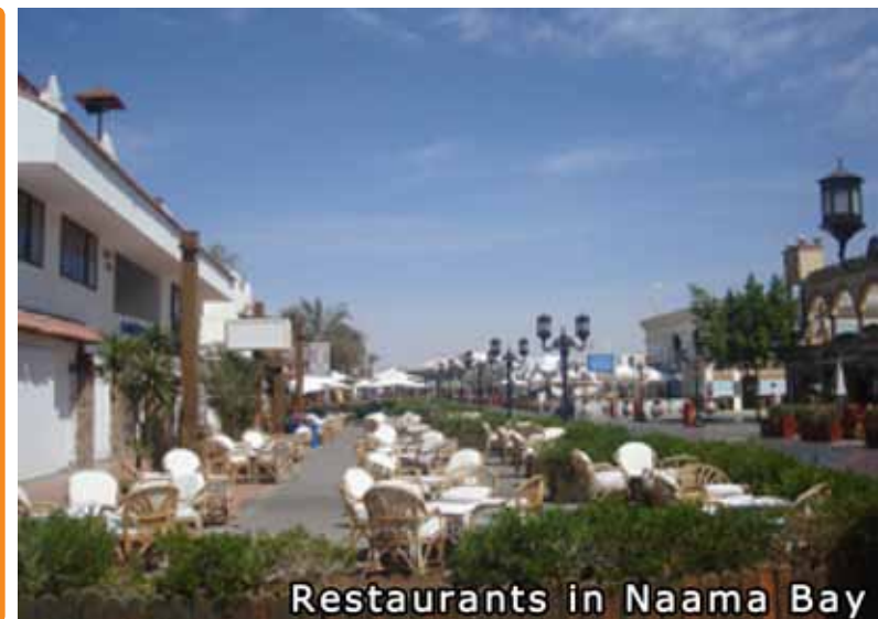
Restaurants in Naama Bay

La legge in Egitto permette ai non-Egiziani l'acquisto di beni immobili fino ad un massimo di 4,000 m 2 . Immobili di dimensioni maggiori richiederanno l'approvazione del Governo. La regione meridionale del Sinai è limitata dai decreti del Primo Ministro del 2005 e il 2007 in cui gli acquirenti, sia cittadini egiziani che no, non possono acquistare proprietà fondiaria assoluta (Freehold). Tutti i contratti sono di base creati come usufrutto per un periodo di 99 anni. I contratti sono firmati con una condizione che, se i decreti fossero annullati, il contratto si trasformerà in contratto per la proprietà fondiaria assoluta (freehold).