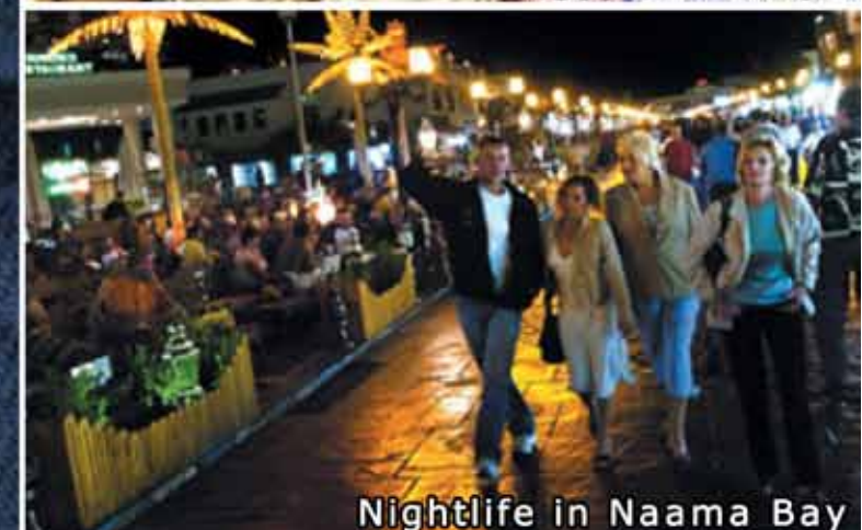
Nightlife in Naama Bay