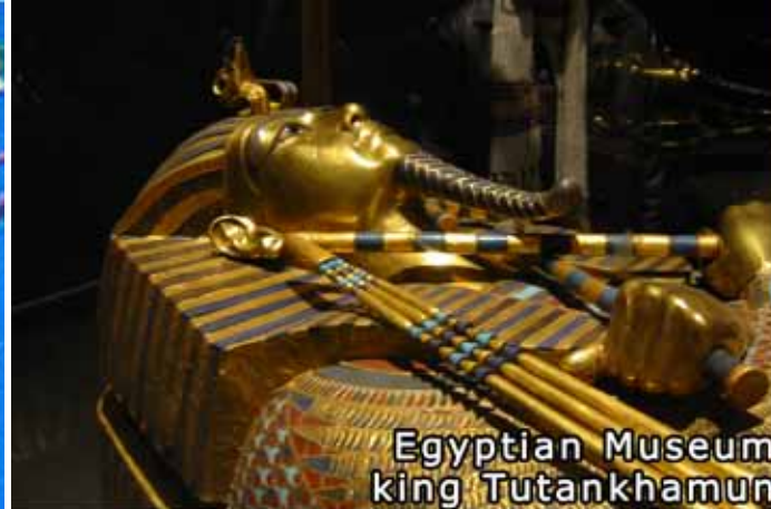
Egyptian Museum king Tutankhamun