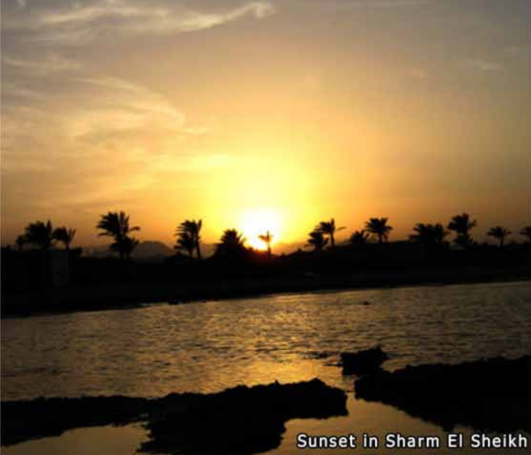
Sunset in Sharm El Sheikh