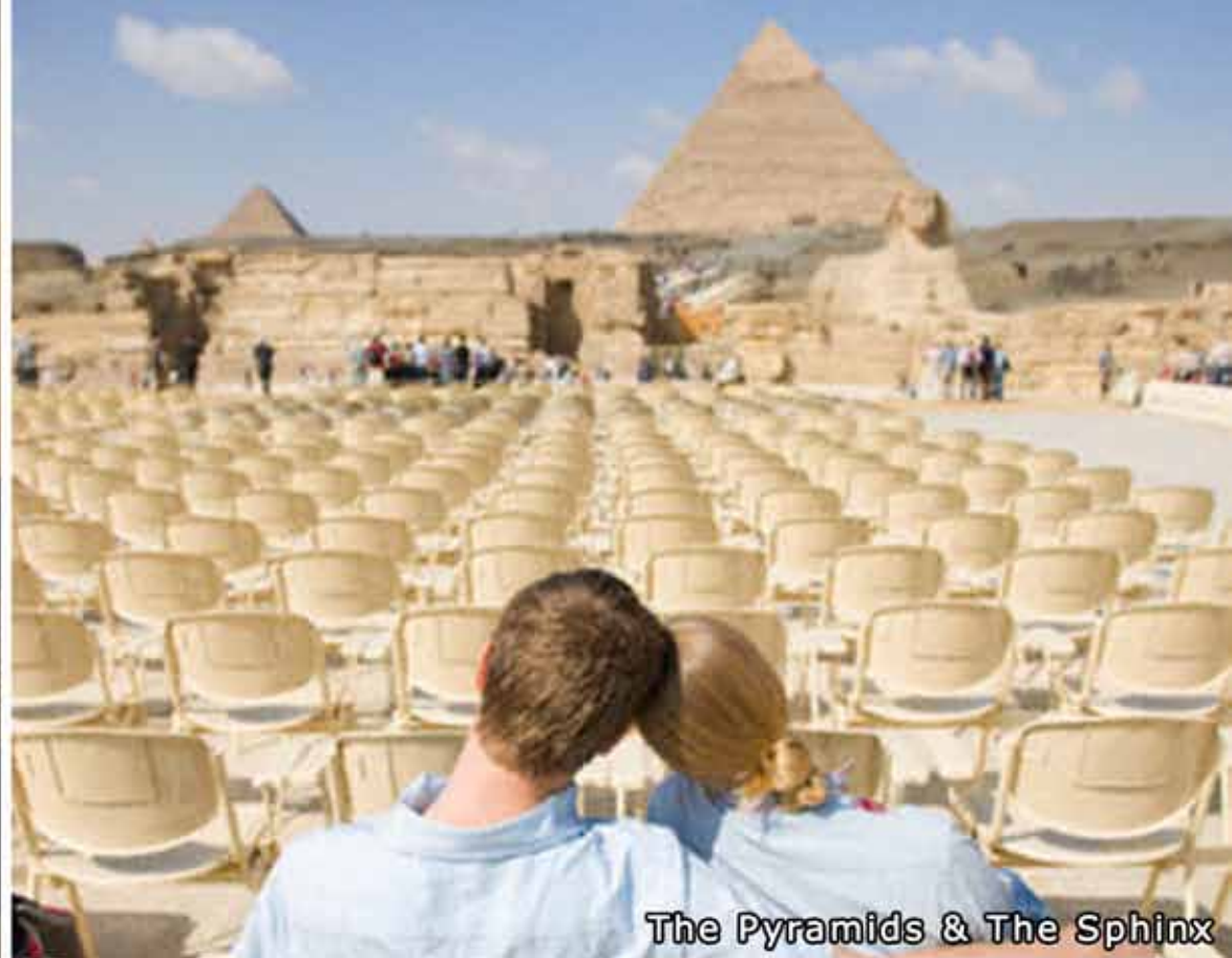
The Pyramids & The Sphinx

Il Ministero del Turismo ha riferito che ci sono stati circa 12,8 milioni di turisti stranieri nel 2008, pari al 15% di crescita all'anno. Si prevede che l'Egitto ospiterà oltre 17 milioni di visitatori all'anno entro il 2020. La penisola del Sinai è particolarmente popolare con turisti provenienti da tutta Europa, Medio Oriente e Stati Uniti d'America. In nessun luogo al mondo ci sono barriere coralline e giardini di così rara bellezza, acque più cristalline o fondali più vari e stupefacenti.