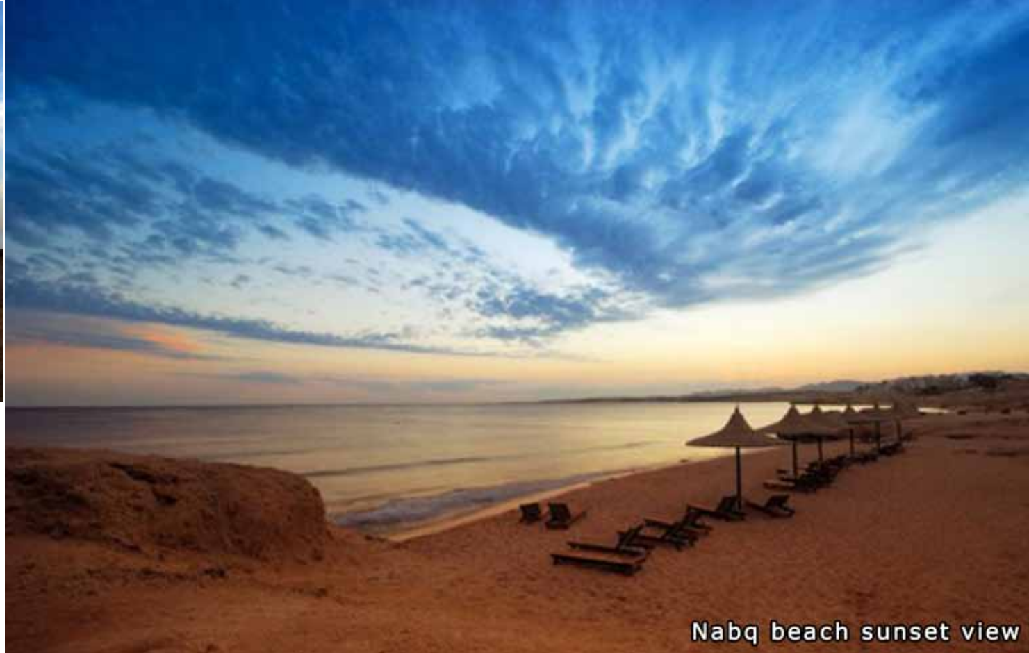
Nabq beach sunset view

Le strutture sono coperte dal Diritto Legale per un periodo di dieci anni. Tutte le altre assicurazioni sono sotto la responsabilità del proprietario dell'immobile.