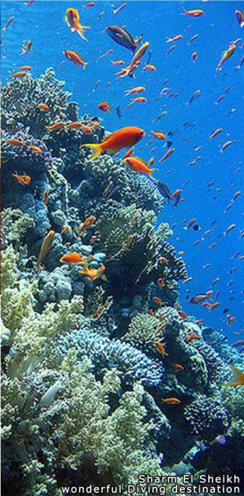
Sharm El Sheikh wonderful Diving destination